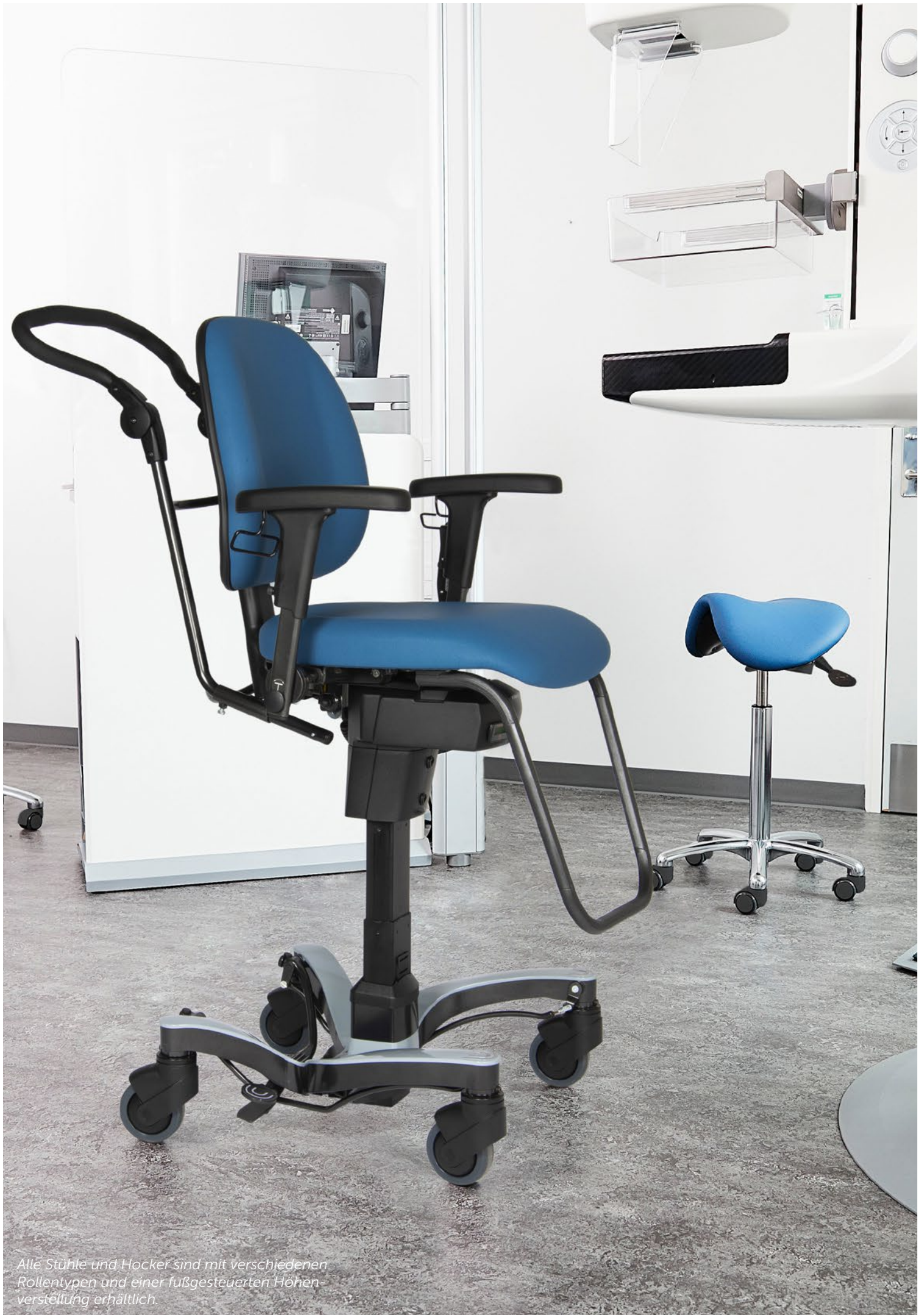
Alle Stühle und Hocker sind mit verschiedenen Rollentypen und einer fußgesteuerten Höhenverstellung erhältlich.